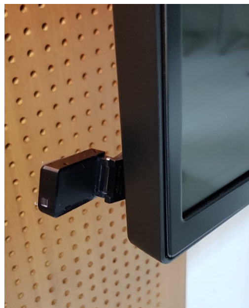
Empfänger Fernbedienung am Display

Bei weiteren Fragen zur Bedienung wenden sie sich bitte an die (IT-Abteilung)