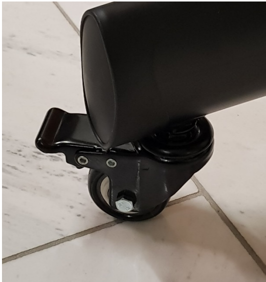
(Bremse ist offen)

Eine Höhenverstellung der Displays darf nur von Fachpersonal (IT-Abteilung) vorgenommen werden!