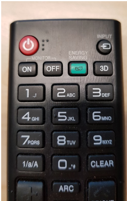
Ein/Ausschalter (Rot) und Input Taste

Über die Pfeiltasten (Oben/Unten) des „Steuerungskreuzes“ wählen sie den betreffenden Eingang aus und bestätigen mit der „OK“ Taste.