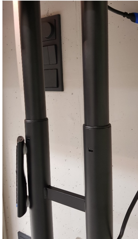
Rollwagen an Gestell anfassen