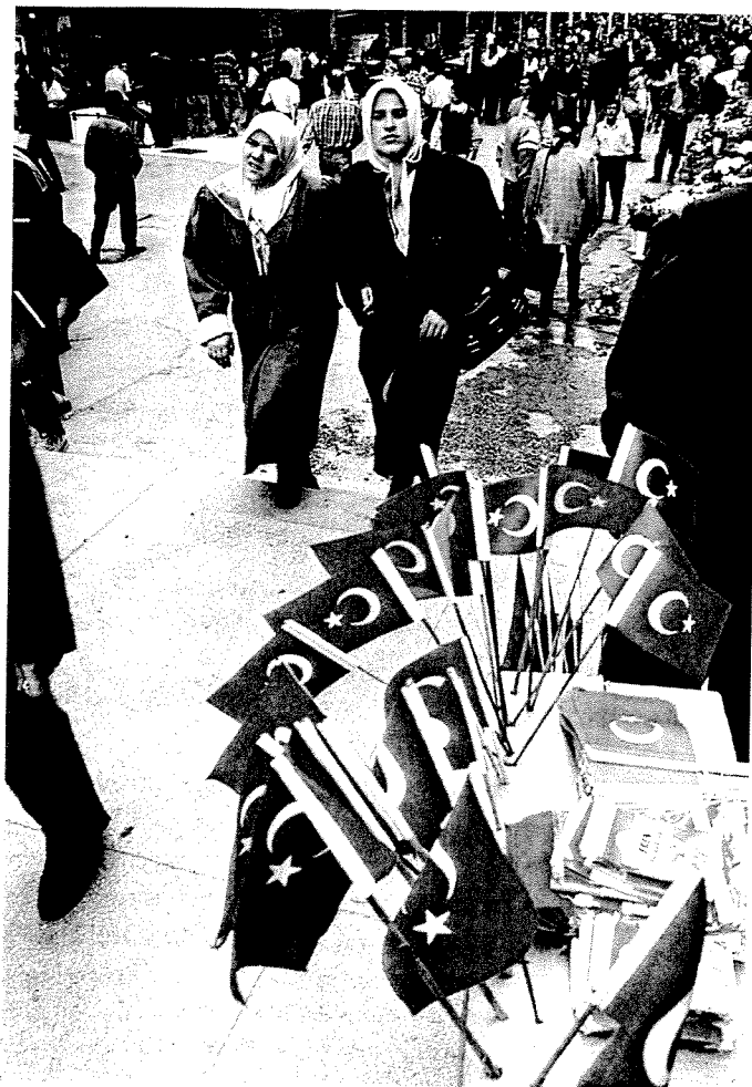
Ankara ist die pulsierende, vier Millionen Einwohner zählende Hauptstadt der Türkei. Seit drei Jahren gibt es dort die Kommunität der Jesuiten.

Erste Erfahrungen: Universität Der Verfasser dieser Zeilen wird, da hier sein hauptsächliches Arbeitsfeld liegt, nun von seinen persönlichen Erfahrungen berichten und daher in die Ichform wechseln. Ich habe an der Universität Bamberg Islamkunde studiert und im Dezember 2002 meine Tätigkeit in Ankara aufgenommen. Der Einstieg war glücklicherweise verhältnismäßig leicht. Denn zum einen habe ich meine Dissertation über moderne türkische Theologen geschrieben [Felix Körner, Revisionist Koran Hermeneutics in Contemporary Turkish University Theology. Rethinking Islam; im Druck]; die Recherche gab mir bereits die Möglichkeit, aus Deutschland Kontakte mit einigen Ankaraer Theo-